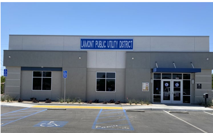
© 2021 Goldstreet Design Agency, Inc. All Rights Reserved

Upon request, the Source Water Assessment report, by the State Water Resources Control Board, Visalia District, may be viewed at the offices of Lamont PUD or a copy may be requested.